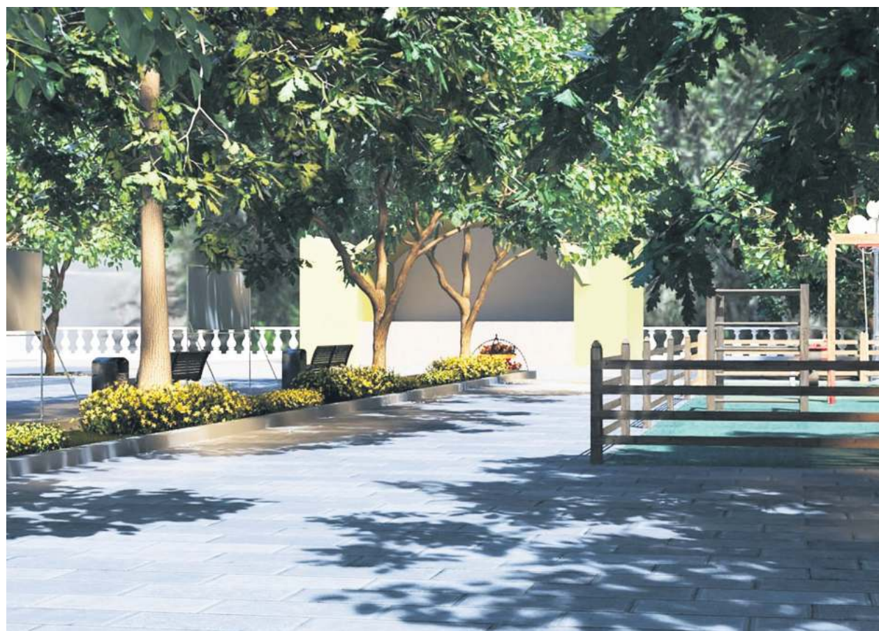
Проект парка около Дворца культуры в Катав-Ивановске.